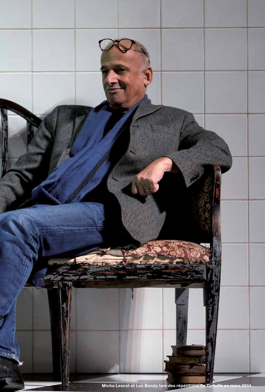
Micha Lescot et Luc Bondy lors des répétitions de Tartuffe en mars 2014