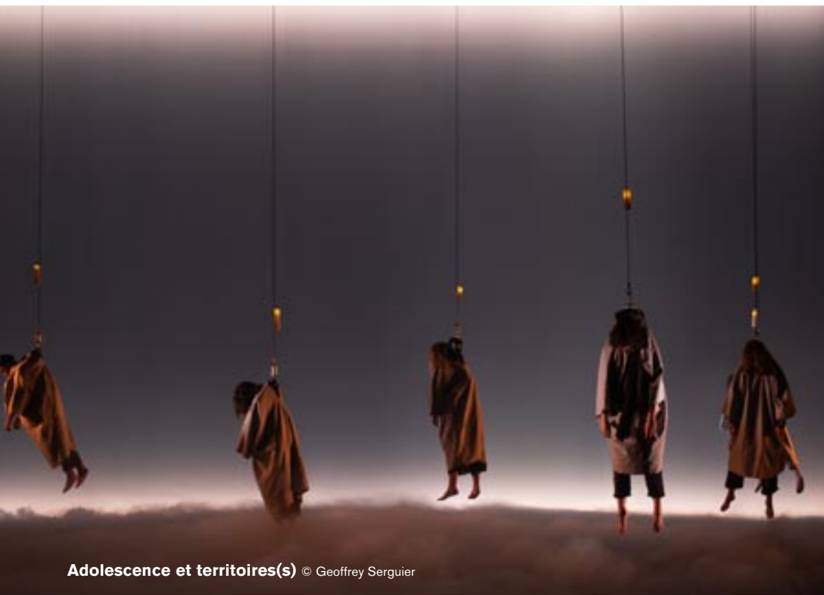
Adolescence et territoires(s)