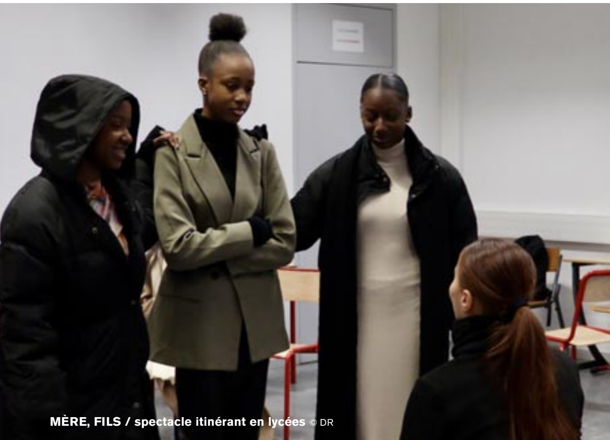
MÈRE, FILS / spectacle itinérant en lycées