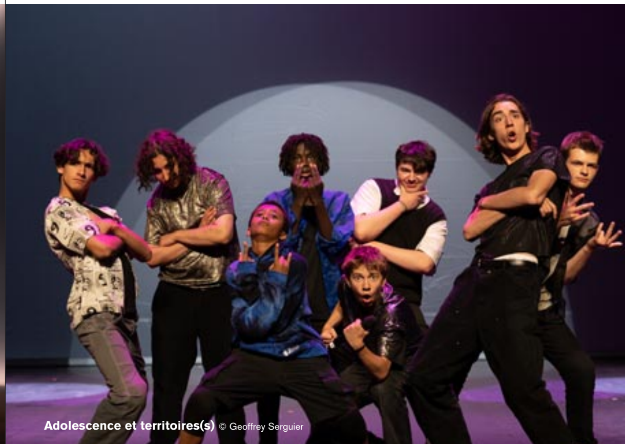
Adolescence et territoires(s) © Geoffrey Serguier