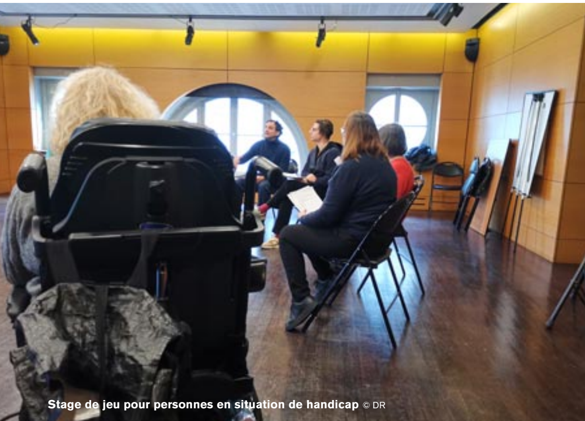
Stage de jeu pour personnes en situation de handicap