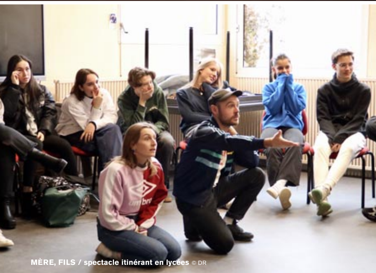
MÈRE, FILS / spectacle itinérant en lycées