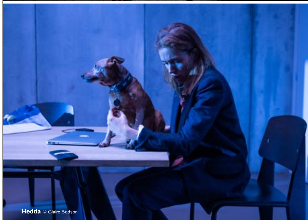
Hedda © Claire Bodson