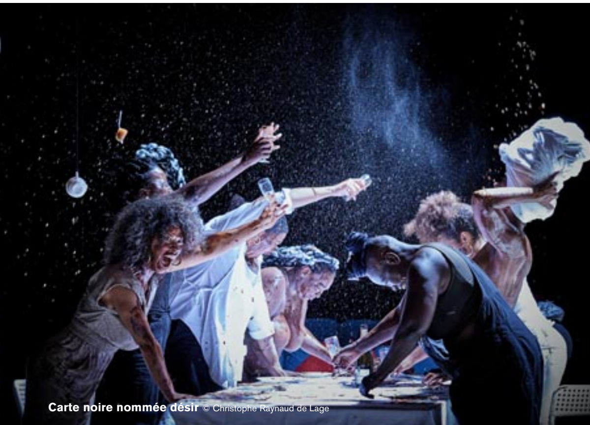
Carte noire nommée désir