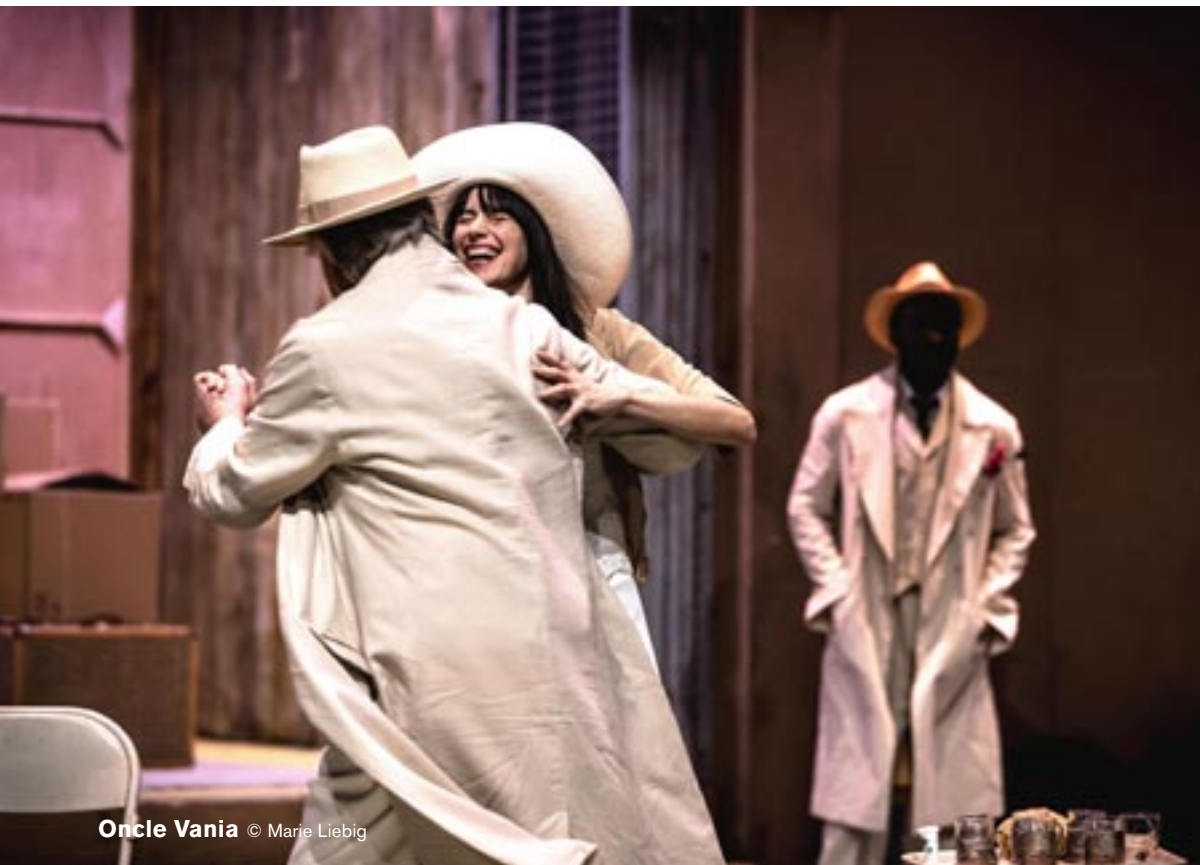
Oncle Vania