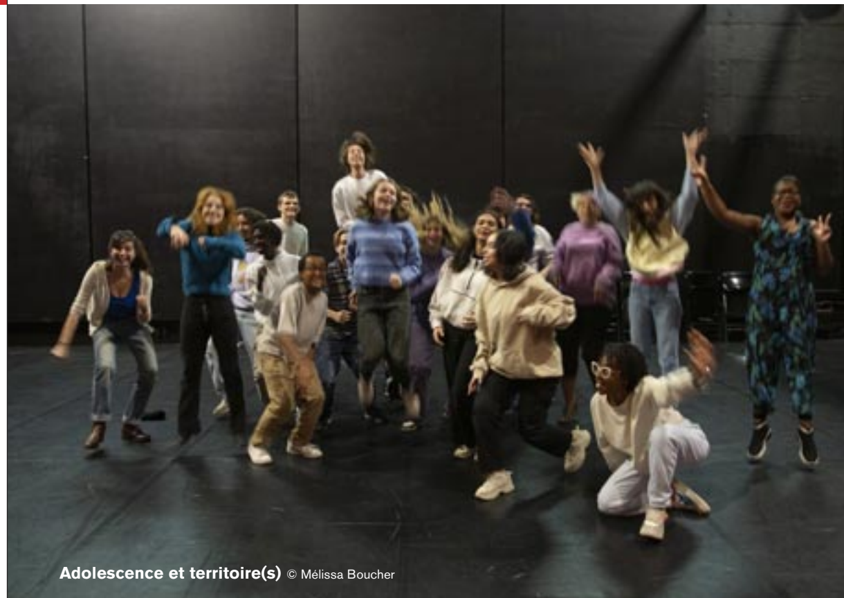
Adolescence et territoire(s)