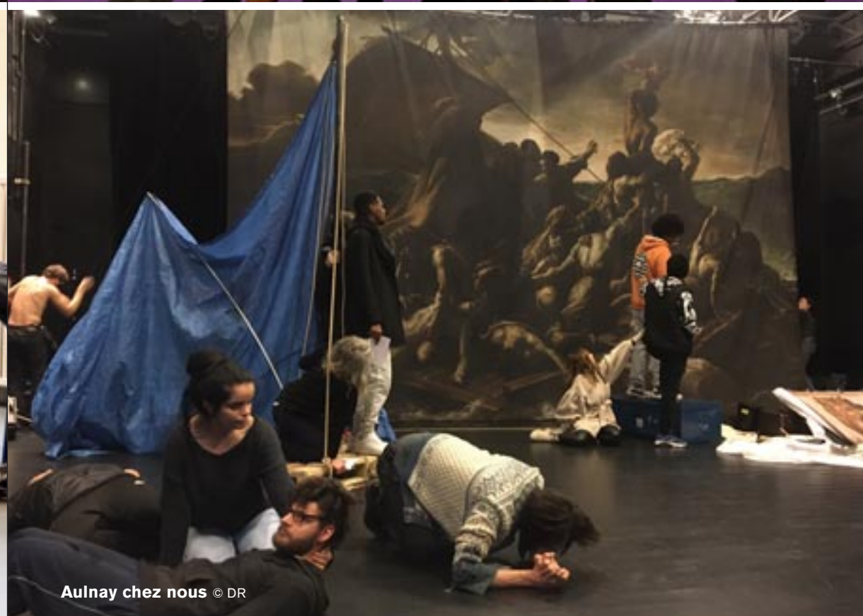
Aulnay chez nous