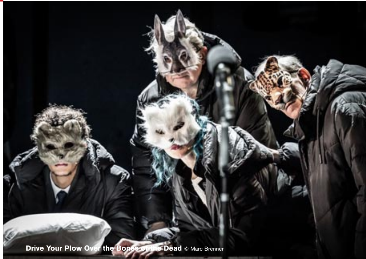
Drive Your Plow Over the Bones of the Dead

Le théâtre a à nouveau pu compter sur des dotations exceptionnelles, pour financer les travaux d'investissement sur les deux sites du 6 e et des Ateliers Berthier. Ce sont ainsi 1,8 M€ de crédits qui ont été consommés en 2023, notamment pendant l'intersaison, qui permet de réaliser les travaux les plus lourds sans impact sur l'activité artistique.