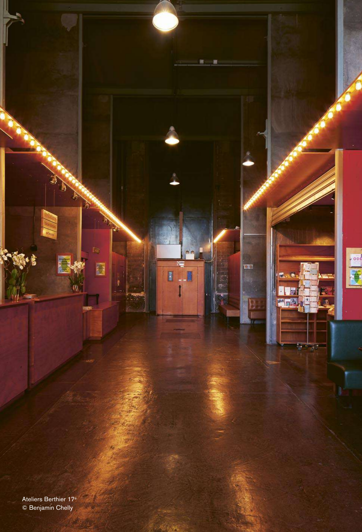
Ateliers Berthier 17 e