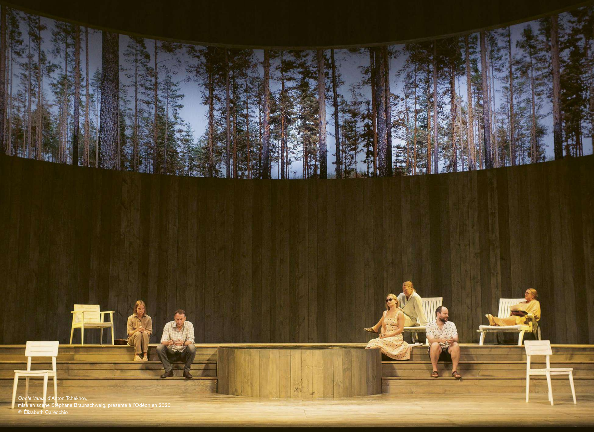
Oncle Vanja , d'Anton Tchekhov, mise en scène Stéphane Braunschweig, présenté à l'Odéon en 2020