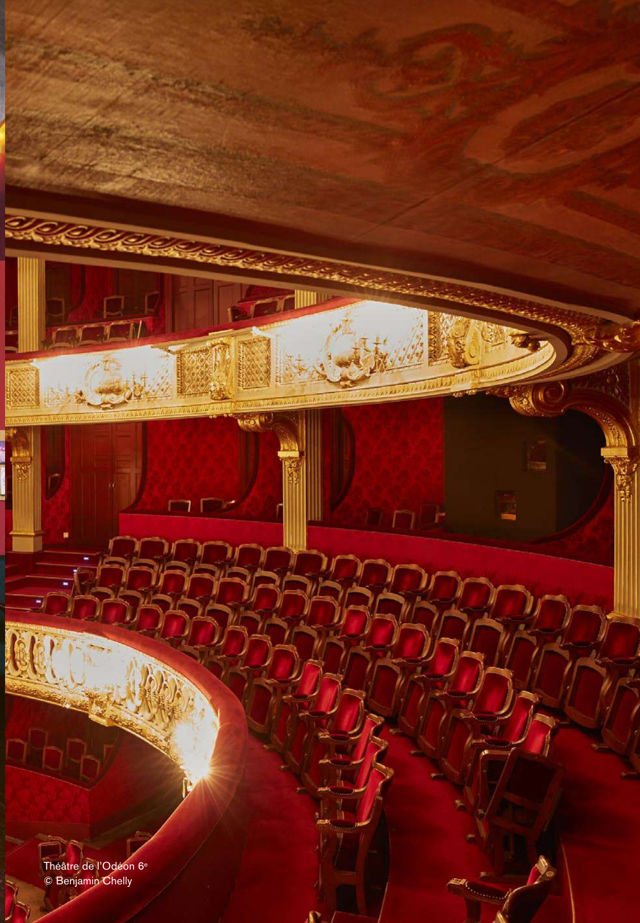
Théâtre de l'Odéon 6 e