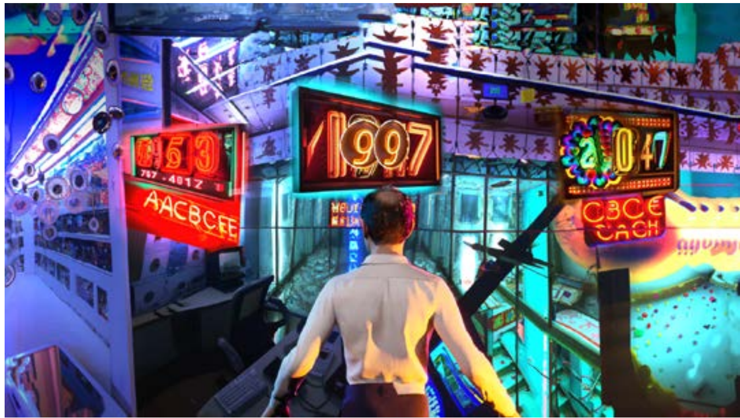
Bahar Noorizadeh, Free to Choose , 2023, vidéo HD avec couleur et son, canal unique, 35min58s, en collaboration avec Rudá Babau et Waste Paper Opera