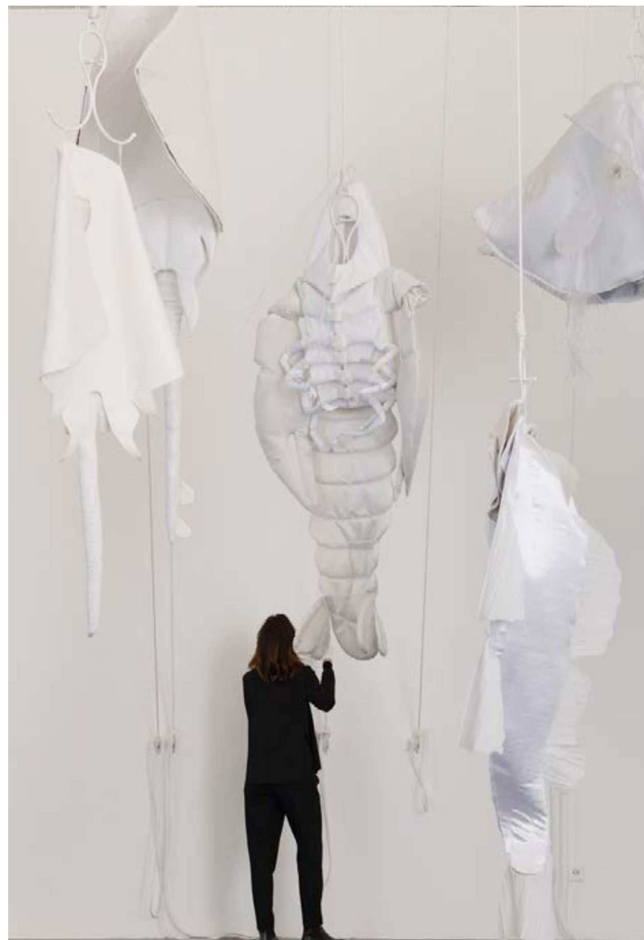
Aline Bouvy, vue de l'exposition Le prix du ticket , Panorama de la Friche Belle de Mai, 2024, coproduction Triangles-Astérides - Marseille et La Ferme du Buisson - Noisiel.