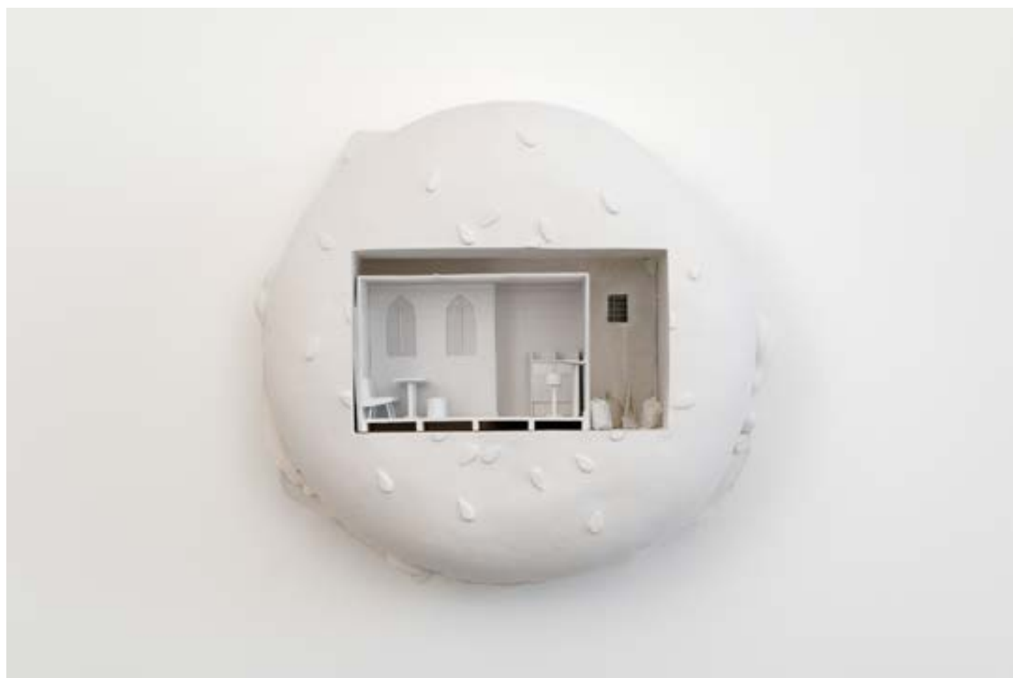
Aline Bouvy, vue de l'exposition Le prix du ticket , Panorama de la Friche Belle de Mai, 2024, coproduction Triangles-Astérides - Marseille et La Ferme du Buisson - Noisiel.