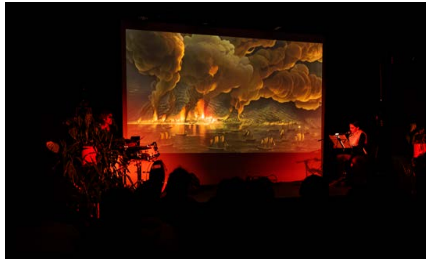
Bahar Noorizadeh et Klara Kofen, Admiror, or Revolutionary Sentiments , 2023, 1h, performance.