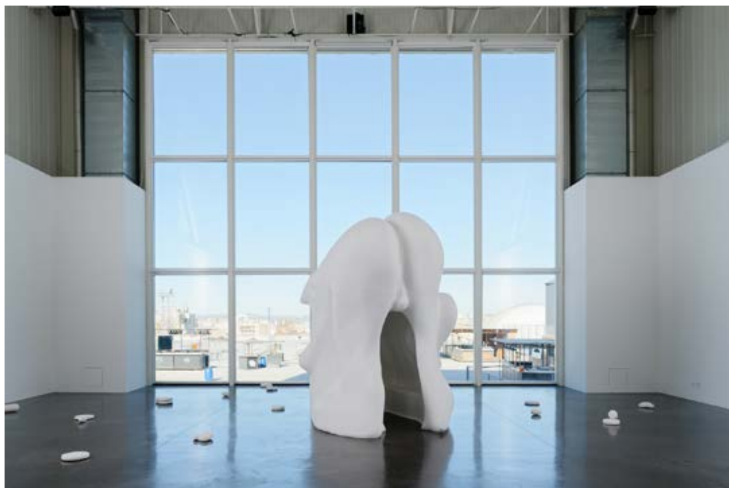
Aline Bouvy, vue de l'exposition Le prix du ticket , Panorama de la Friche Belle de Mai, 2024, coproduction Triangles-Astérides - Marseille et La Ferme du Buisson - Noisiel.