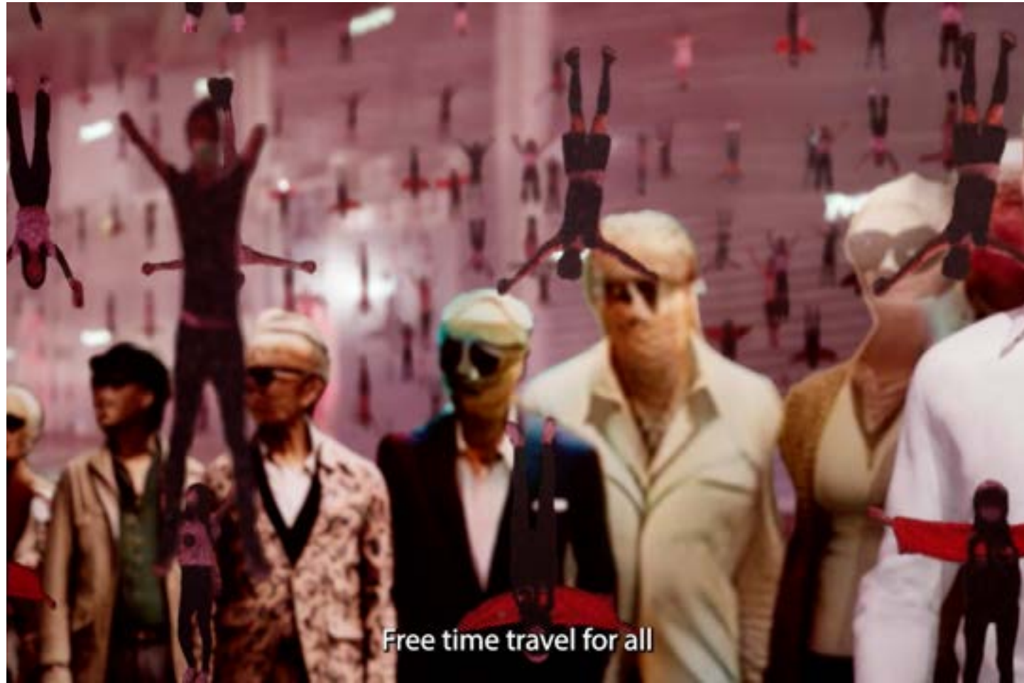
Bahar Noorizadeh, Free to Choose , 2023, vidéo HD avec couleur et son, canal unique, 35min58s, en collaboration avec Rudá Babau et Waste Paper Opera, courtesy de l'artiste © Bahar Noorizadeh