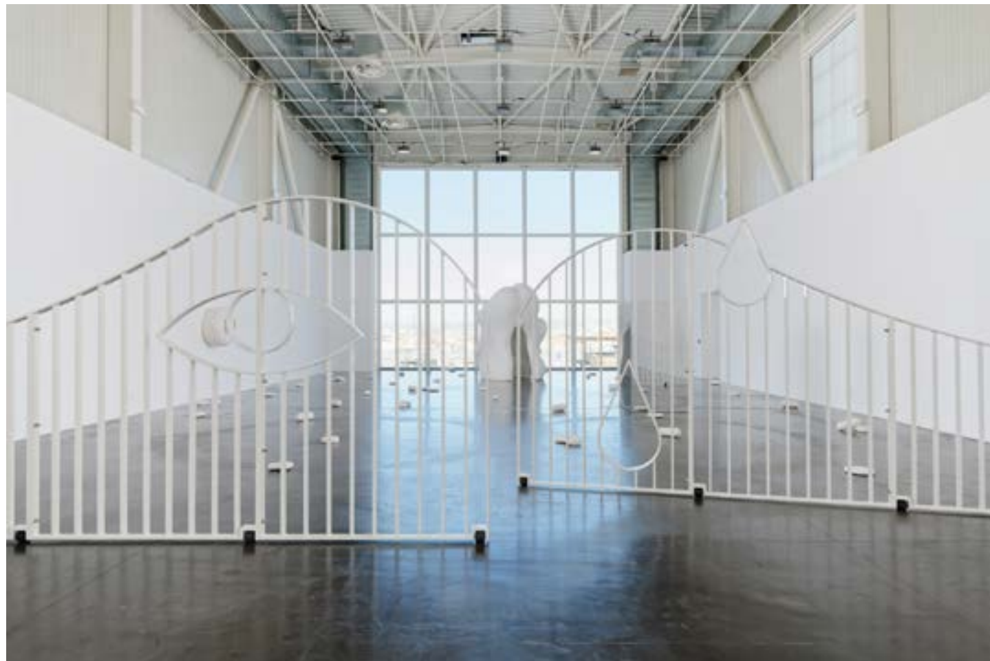
Aline Bouvy, vue de l'exposition Le prix du ticket , Panorama de la Friche Belle de Mai, 2024, coproduction Triangles-Astérides - Marseille et La Ferme du Buisson - Noisiel.