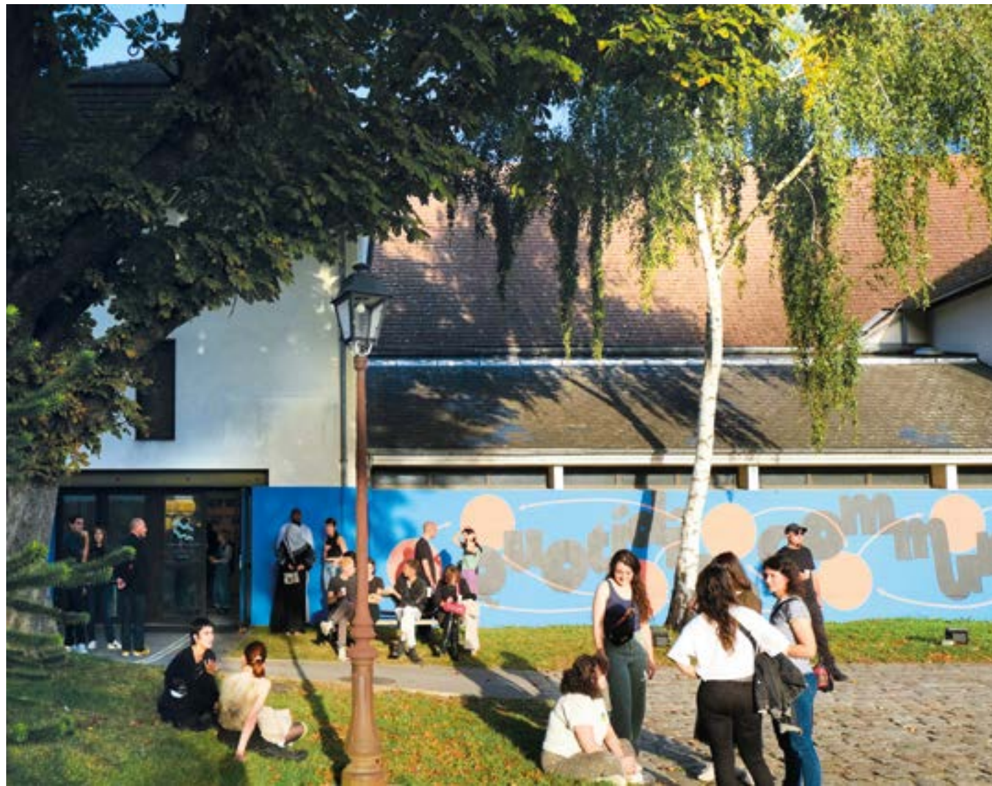
Vernissage de l'exposition Quotidien Communs , le 7 octobre 2023, © Nina De Castro