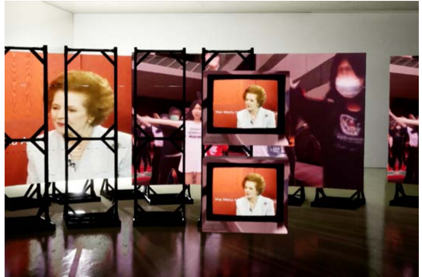
Bahar Noorizadeh, Free to Choose , 2023, vidéo HD avec couleur et son, canal unique, 35min58s, en collaboration avec Rudá Babau et Waste Paper Opera