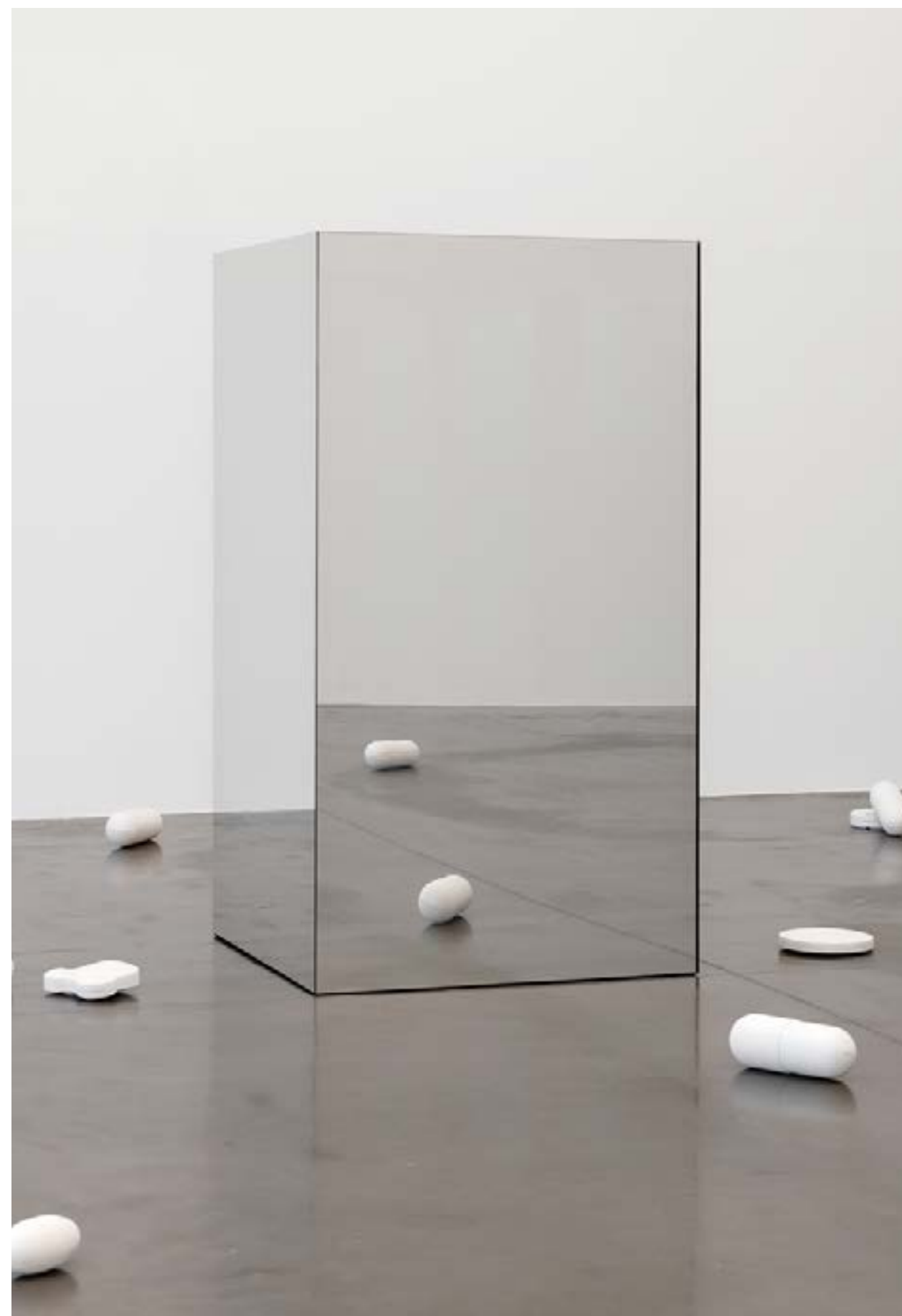
Aline Bouvy, vue de l'exposition Le prix du ticket , Panorama de la Friche Belle de Mai, 2024, coproduction Triangles-Astérides - Marseille et La Ferme du Buisson - Noisiel.