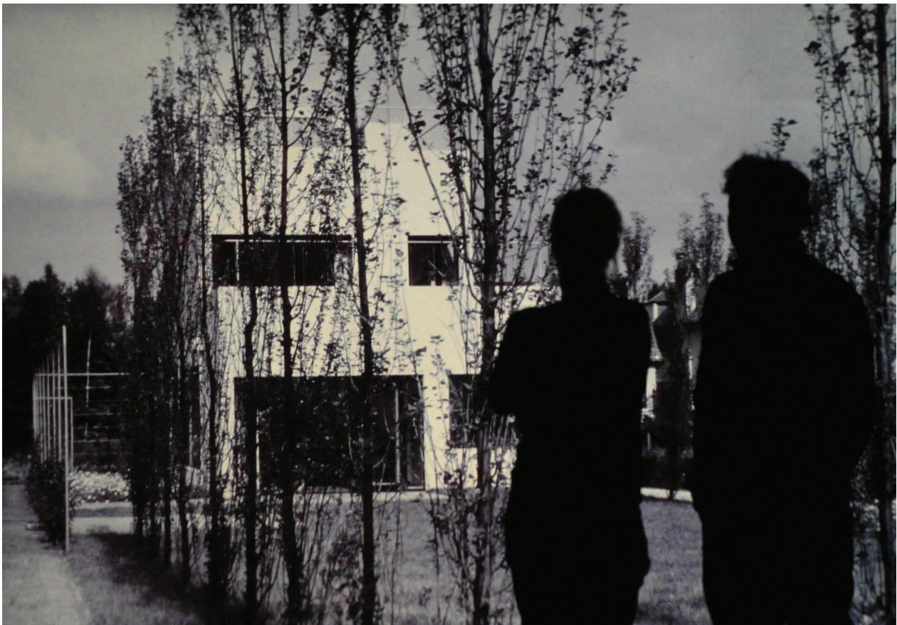
Eduarne Rubio, The Visitors (working title) , 2012

La recherche d'Eduarne Rubio (née en 1974) a toujours été en rapport avec la perception individuelle et collective du temps et de l'espace. Intéressée par les contextes qui font de la perception une donnée variable et mutante, oubliée ou archivée, elle cherche à mettre en association ou en opposition des façons de percevoir la réalité avec l'objectif de créer une deuxième réalité composée. Depuis quelques années, son travail se rapproche du documentaire et de l'anthropologie, avec l'utilisation d'interviews, d'images d'archives et de la recherche sur la communication orale.