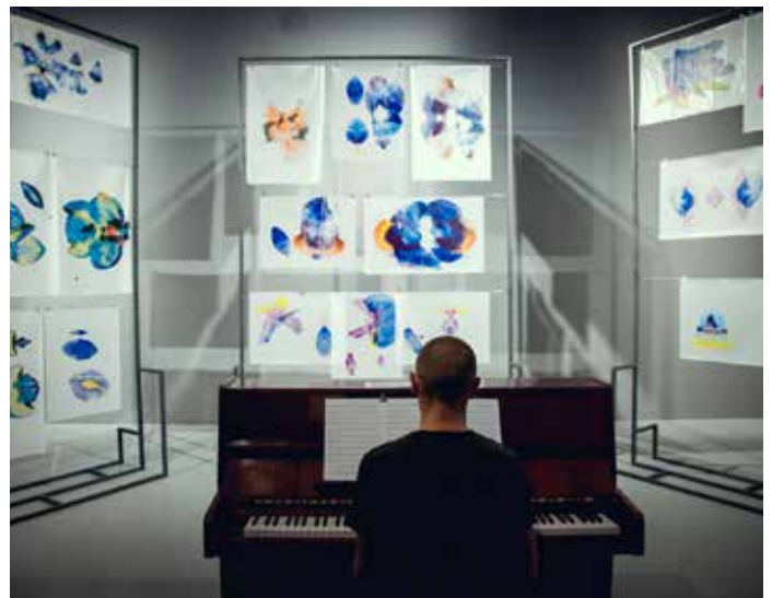
Alex Cecchetti "Tamam Shud" exhibition view. Ujazdowski Castle Centre for Contemporary Art. Curated by The Book Lovers. Music Room, Concerto Nuovo (performer: Natan Kryszk).