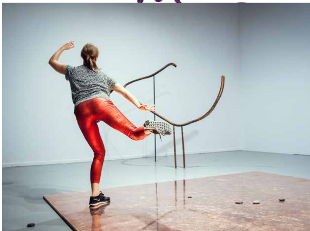
Alex Cecchetti "Tamam Shud" exhibition view. Ujazdowski Castle Centre for Contemporary Art. Curated by The Book Lovers. Dance Room.