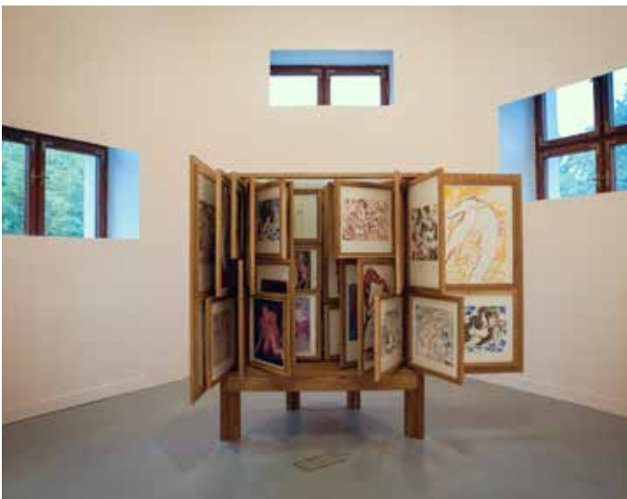
Alex Cecchetti "Tamam Shud" exhibition view. Ujazdowski Castle Centre for Contemporary Art, 2017. Curated by The Book Lovers. Erotic Cabinet.