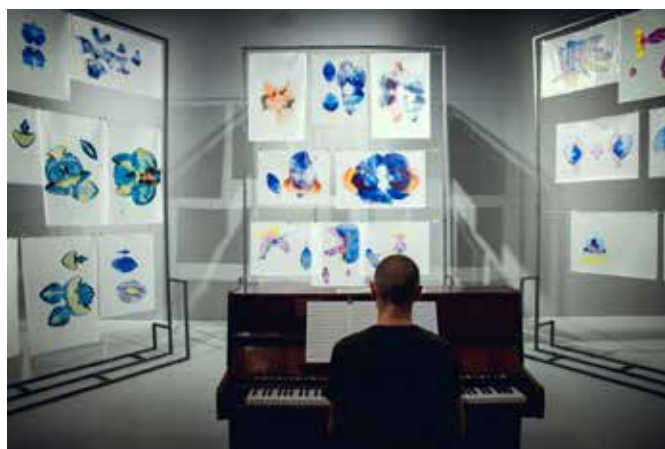
Alex Cecchetti Tamam Shud . Music Room, Concerto Nuovo (performer: Natan Kryszk).