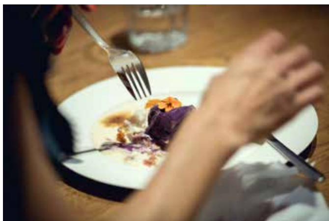
Alex Cecchetti Tamam Shud , Dinner Room, Le Chevalier.