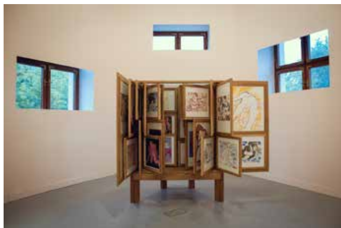
Alex Cecchetti Tamam Shud , Erotic Cabinet.