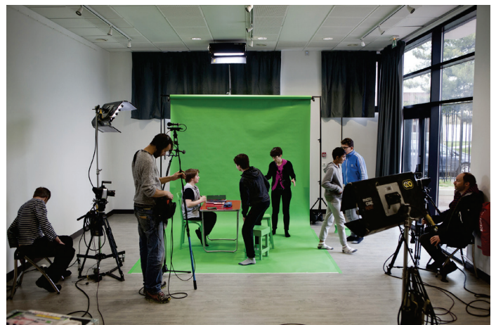
Céline Ahond, Jouer à faire semblant pour de vrai , 1% artistique du collège Pierre Curie - Bondy, 2016