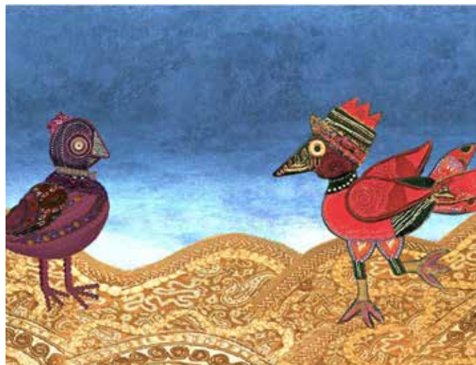
© Cristina Lastrego et Francesco Testa