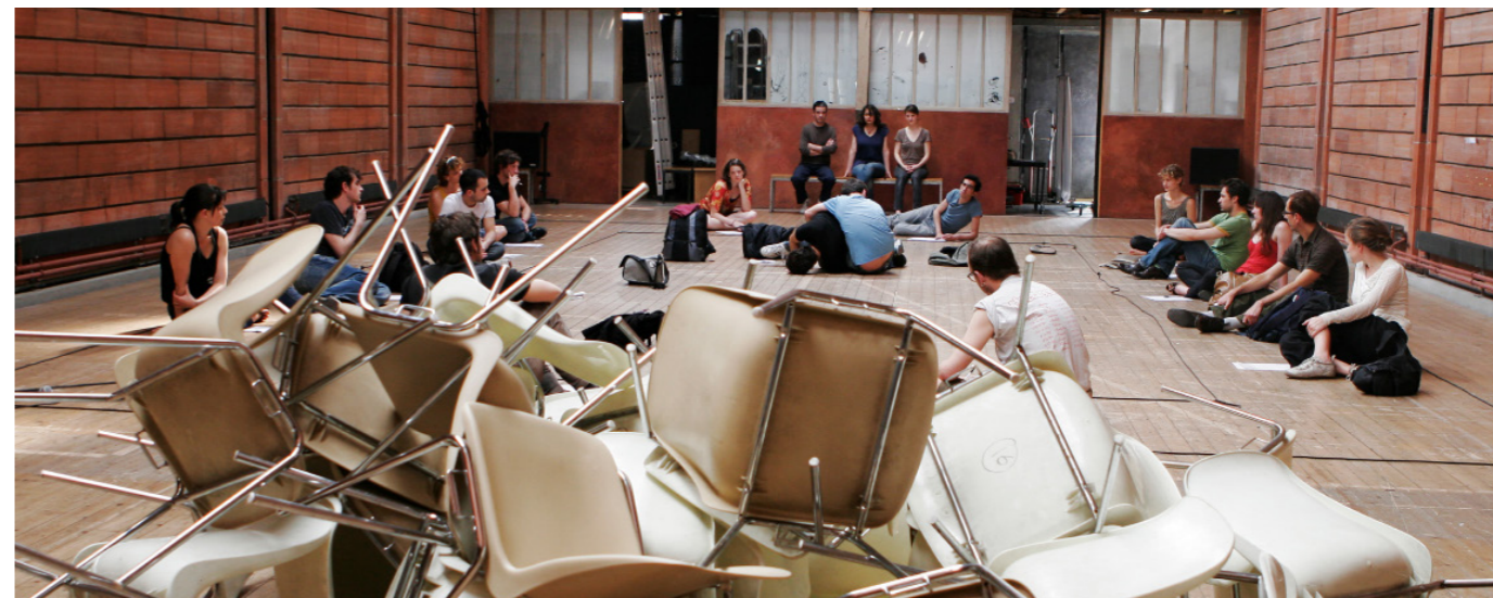
Topographie des forces en présence © Nathalie Fixon