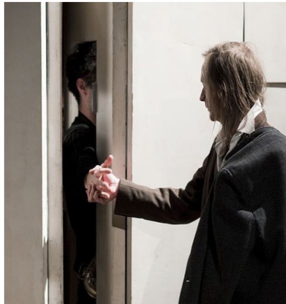
La Machinajouer © Vincent Beaume