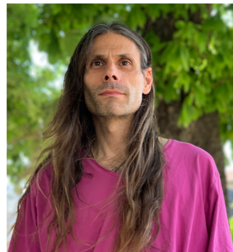
Aurélien Barrau à Grenoble en 2019