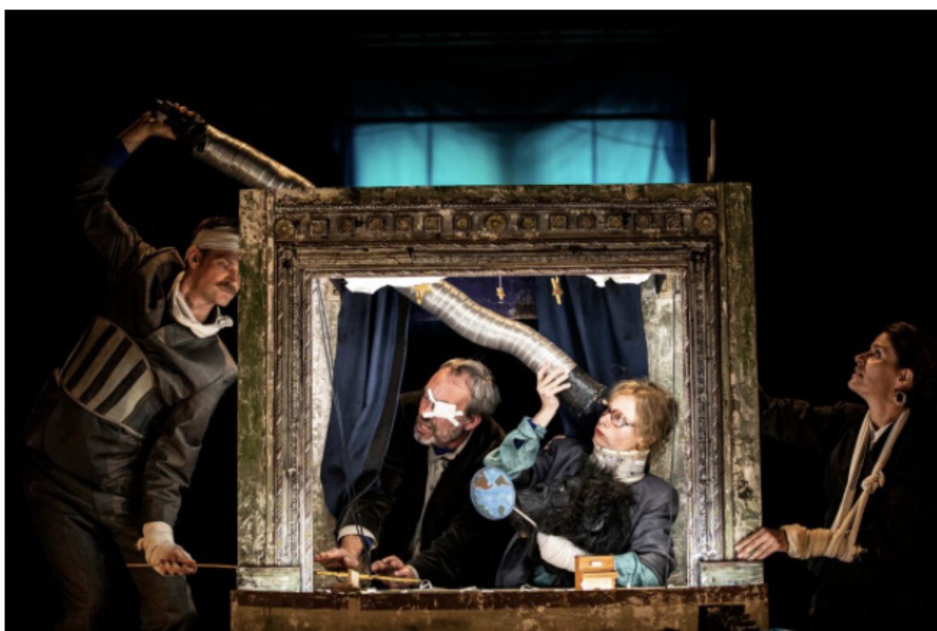
Scène de "Fusées"