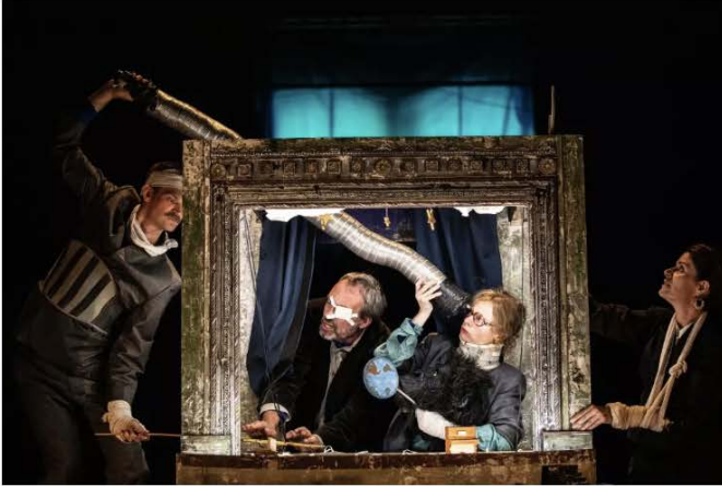
Fusées de Jeanne Candel © Jean-Louis Fernandez