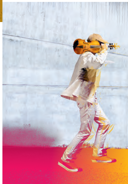
Direction et violon Amandine Beyer

Haendel, Vivaldi, Purcell, Telemann, Gluck... Que diriez-vous d'explorer l'Europe en musique le temps d'un après-midi ? Avec comme guide Amandine Beyer, l'une des plus grandes violonistes baroques de notre temps, l'Orchestre national d'Île-de-France vous convie à une traversée de Londres à Venise, en grande compagnie.