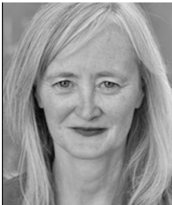
l'huissière - Emilie - Sophie - Jeanine - un skinhead - une policière