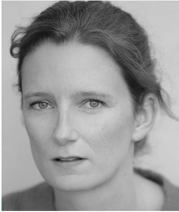
Marie-Ange - Céleste - Lydia - La Hyène - Pamela