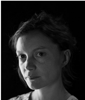
la gardienne - la fille du bus - Gaëlle - Sylvie - la dame de service - Daniel - Olga - Vodka Satana