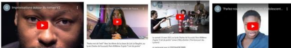
Lycéens de Saint-Denis en partenariat avec le TGP

Ces actions visent à promouvoir l'art théâtral et à enrichir l'expérience culturelle des étudiants à travers des interventions variées et stimulantes.