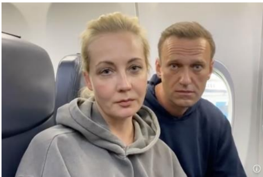
Yulia et Alexei Navalny dans le vol Berlin-Moscou le 17 janvier 2021