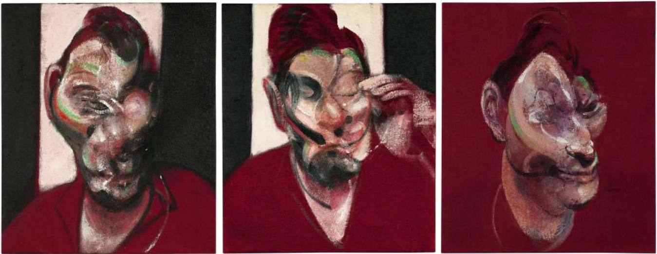
Three Studies For A Portrait of Lucian Freud, Francis Bacon

déplacements chorégraphiés dans l'espace, changements de costume rapides. Chaque mouvement devra être fluide et agile, exécuté avec une grande précision. On fera de la pièce une danse magique où apparaît sans qu'on s'en aperçoive un nouveau personnage ou un nouvel espace. Je m'attacherai à ce que les chorégraphies respectives des acteurs soient maîtrisées avec virtuosité, afin d'embarquer le corps du spectateur dans le voyage, corps émotionnel, énergétique, mental et spirituel.