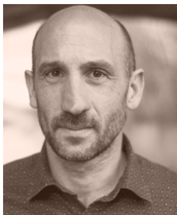
Le témoin / Le faune