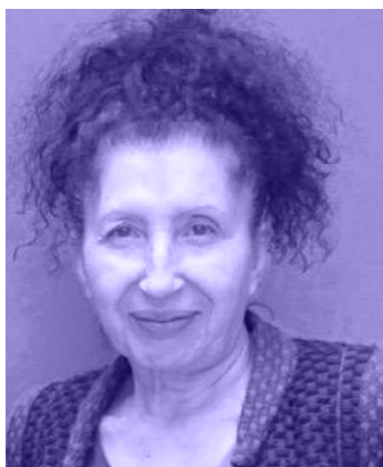
Yema, la grand-mère