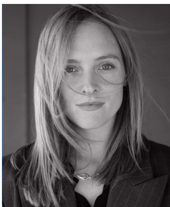
La Femme de ménage et l'Enfant