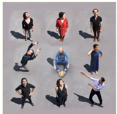
soundinitiative - new music ensemble