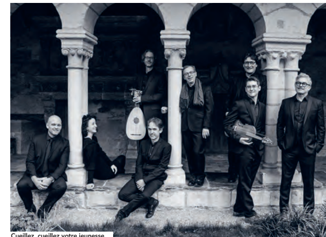
Cueillez, cueillez votre jeunesse

TARIF APRÈS-MIDI > CAT. A : 20 € / 15 € / GRATUIT