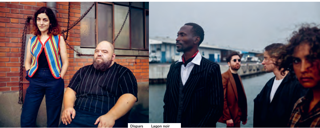
Dispars Lagon noir