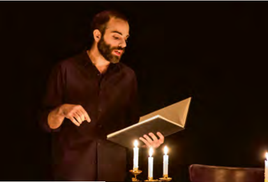
Les Caractères de La Bruyère

Pique-nique libre, restauration légère au salon de thé et à la buvette ou panier repas à réserver en billetterie.