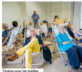
Cinéma pour les oreilles