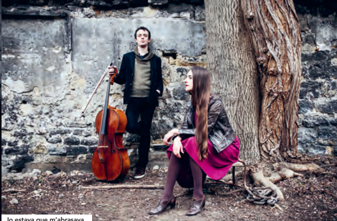
Jo estava que m'abrasava