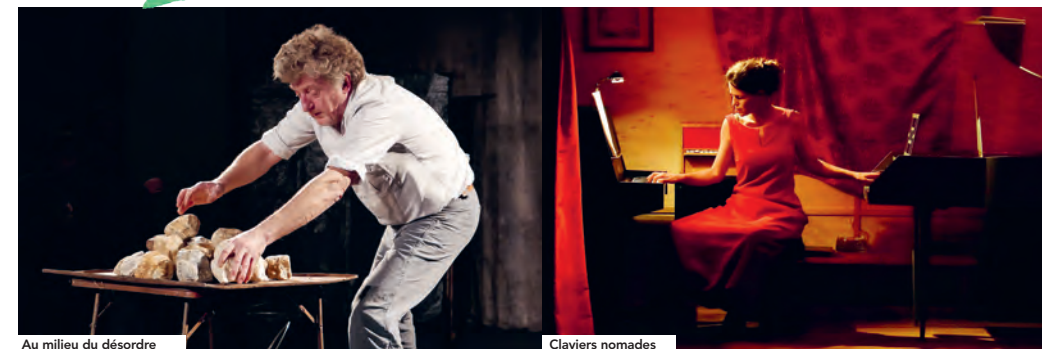
Au milieu du désordre