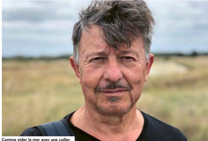
Comme vider la mer avec une cuiller