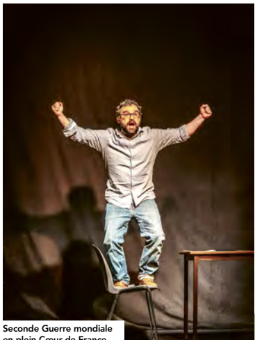
Seconde Guerre mondiale en plein Cœur de France

Avec le soutien de l'Oara / Spectacle programmé dans le cadre du dispositif A Vos ID et avec le soutien du programme Leader