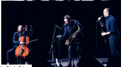
Le Cri du Caire