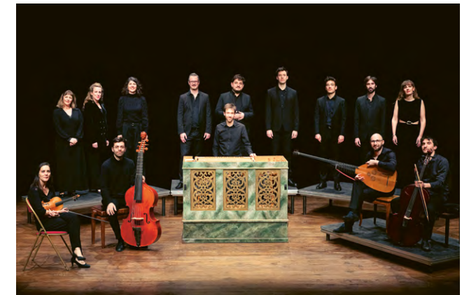
Requiem pour Christine de Suède - L'Escadron Volant de la Reine