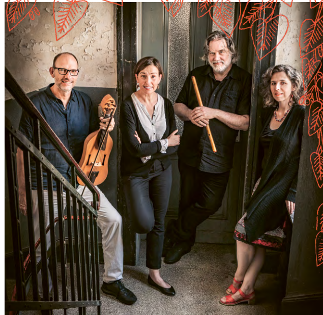
Nexus Winchester - Dialogos