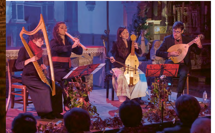
Bestiaire - ApotropaïK