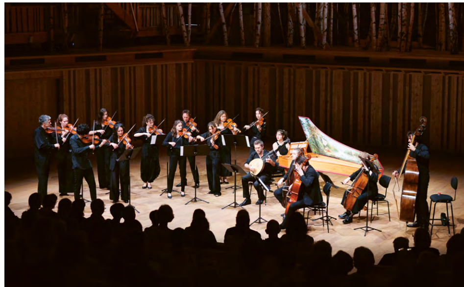
Vivaldi Reloaded - Le Consort