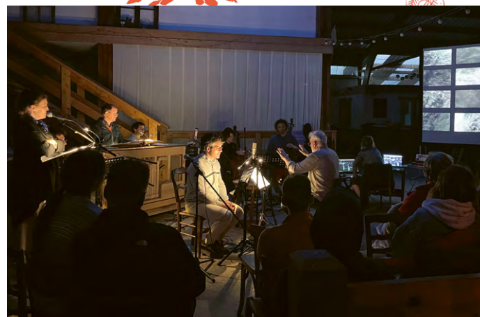
À l'écoute de la zone critique - Les Épopées