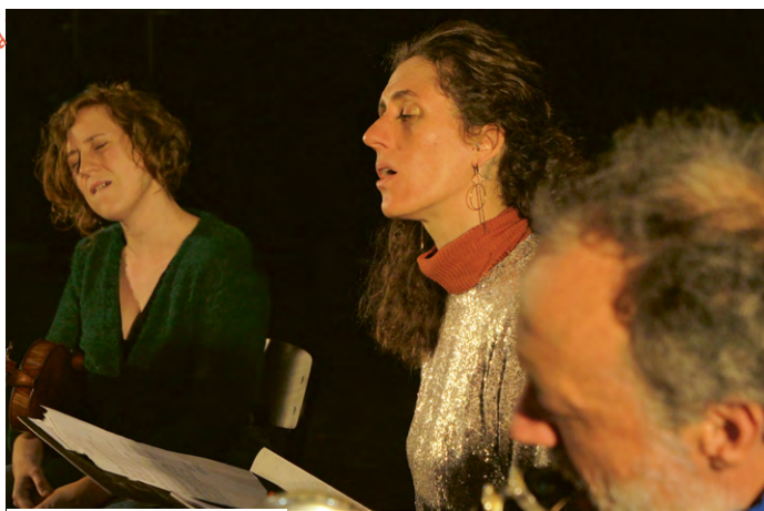
Chants crépusculaires - Les Réveillés