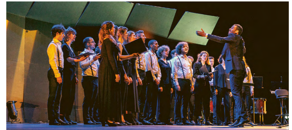
Pèlerinage(s) - Ensemble vocal InChorus