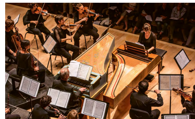
Bach Cantates - Il Convito