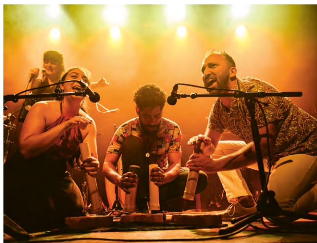
Tambores afro venezealos - Parranda La Cruz